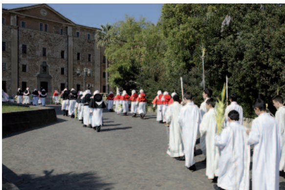
Le confraternite alla processione della Domenica delle Palme