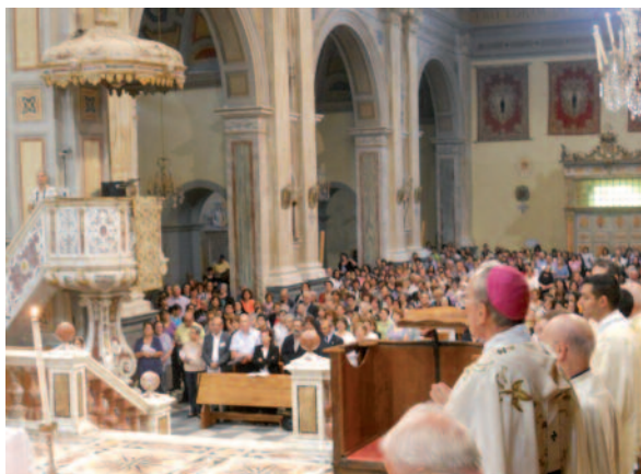
Assemblea sinodale